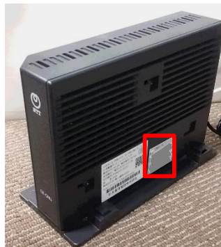
側面に貼付されている シール