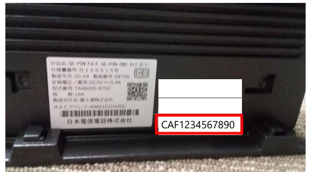
お客さまIDが記載されています。