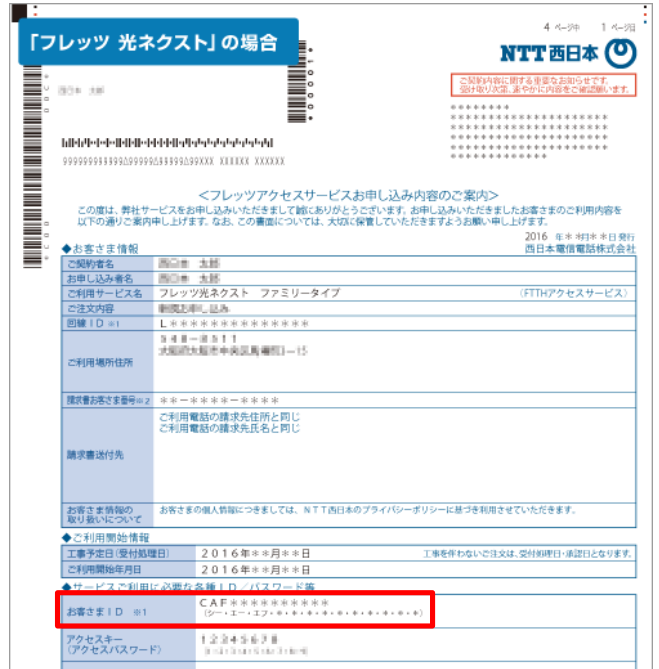
「お申し込み内容のご案内」のイメージ

※参考URL： https://flets-w.com/user/about_id/